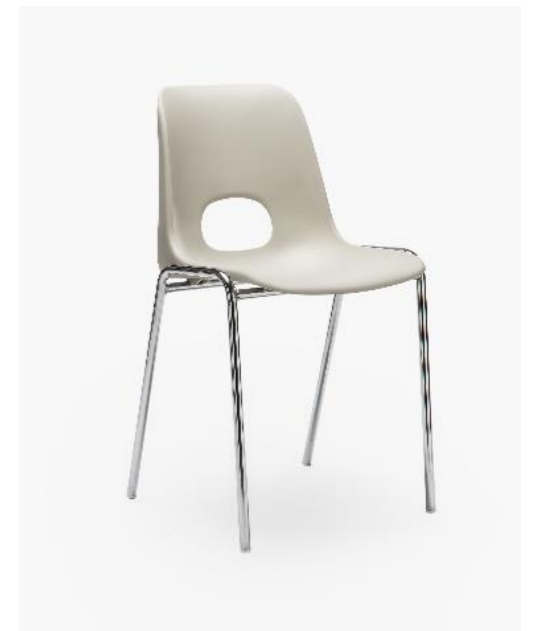
COL. 12 GRIGIO SETA RAL 7044 (*)