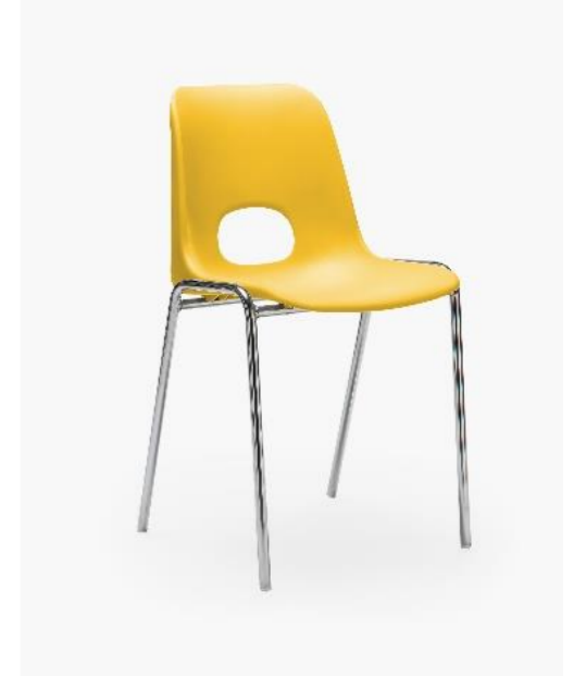
COL. 01 GIALLO TRAFFICO RAL 1023