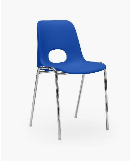
COL. 15 BLU SEGNALE RAL 5005