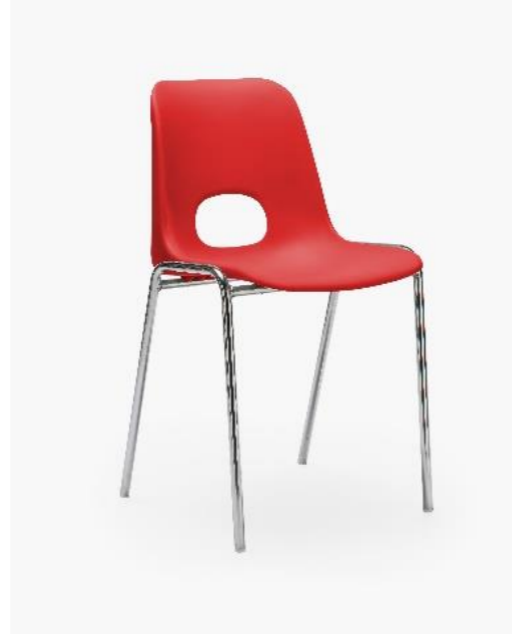
COL. 11 ROSSO TRAFFICO RAL 3020