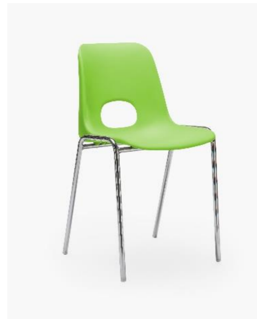
COL. 19 VERDE PASTELLO PANTONE 367C