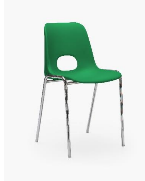
COL. 02 VERDE BRILLANTE PANTONE 3415C (*)