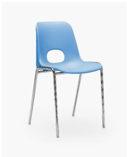
COL. 17 CARTA ZUCCHERO PANTONE 278C

(*) il colore e simile al riferimento di collana