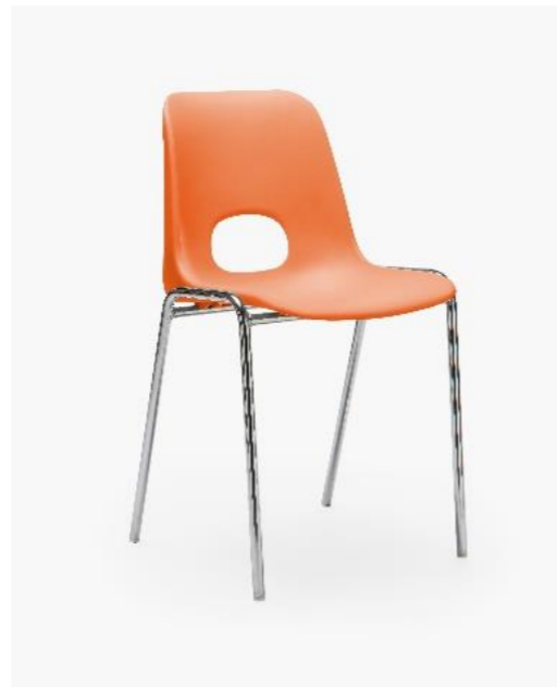
COL. 21 SALMONE PANTONE 163C

(*) il colore e simile al riferimento di collana